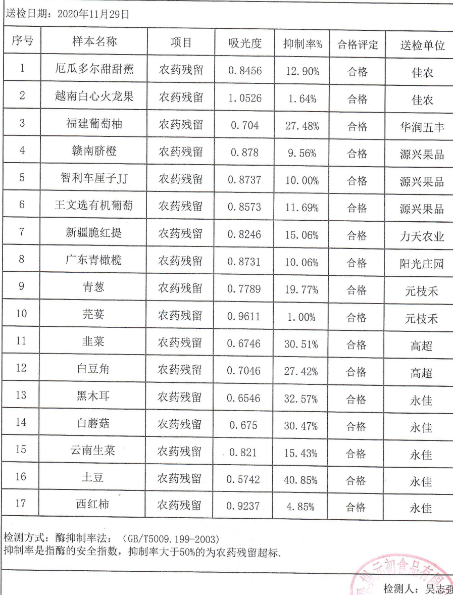
深圳元初水果蔬菜农药残留测量数据表